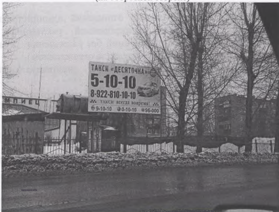
Фото рекламной конструкции (на оборотной стороне)

* В соответствии со ст. 14.37. КоАП установка и (или) эксплуатация рекламной конструкции без предусмотренного законодательством разрешения на ее установку и эксплуатацию влекут наложение административного штрафа: